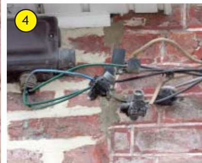
foto 1 en 2 Mechelsesteenweg 288 - foto 3 en 4 Mechelsesteenweg 274 - 284