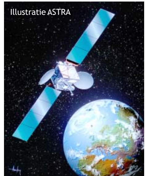
De Astra op 36.000 km hoogte.