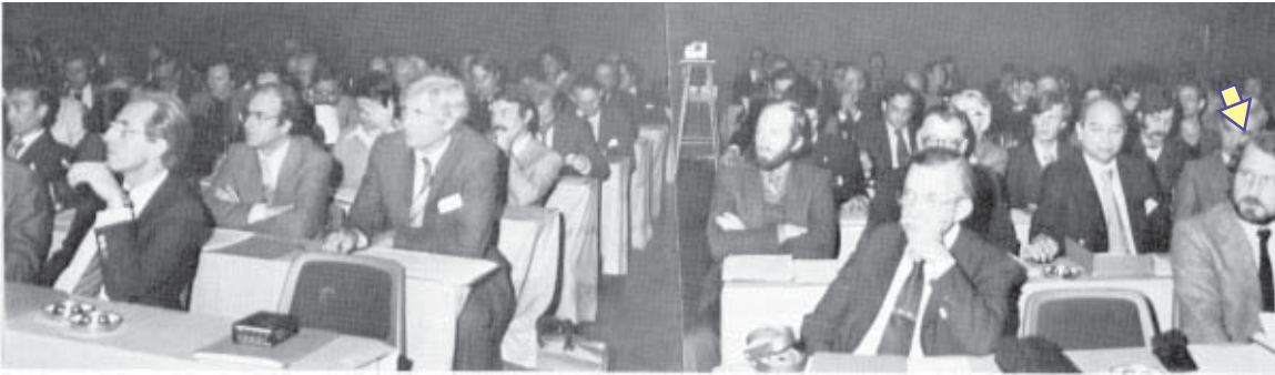
Studiedag Omroepsatelliet te Antwerpen op 14 november 1979 - Uiterst rechts (pijl) de hoofdredacteur van Morsum Magnificat die toen al bij het satellietgebeuren betrokken was.

betreft een aanvulling van 10 extra programma's waarbij de aandacht gaat naar jeugd, sport, ontspanning en erotiek.