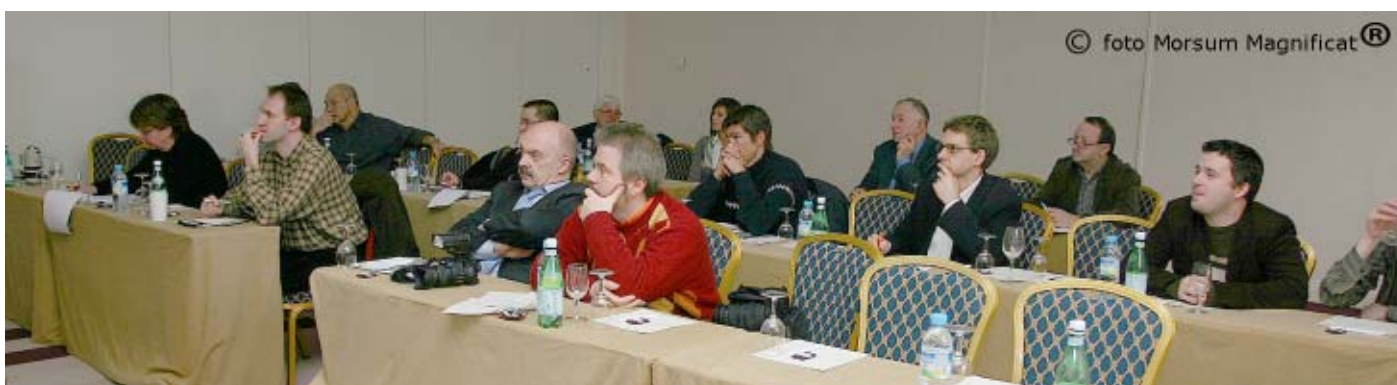
De aanwezigen op de persvoorstelling van TV Vlaanderen in het Crowne Plaza Brussels City Centre

brengt, is het vrij jonge team erin geslaagd om meer dan 30.000 klanten voor TV VLAANDEREN digitaal aan te trekken, niet slecht, tenslotte staan ze in een exploderende wereld van digitale communicatie ook nog maar in hun kinderschoenen, dat zal TV VLAANDEREN in de komende maanden misschien nog parten spelen, de capaciteit van een satelliet is ook niet onuitputtelijk. Toch halen we binnen de zes maanden de resultaten die we voor 12 maanden beoogden, stellen ze bij TV Vlaanderen terecht euforisch.