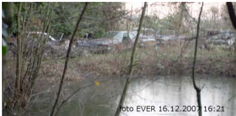
De buren vinden het onverantwoord dat al die autowrakken daar maar blijven liggen.

en dat alle politici uit hetzelfde hout gesneden zijn, toegevingen en concessies doen, mond en ogen dichtdoen om toch maar mee te kunnen spelen is ook te Rotselaar duidelijk. In de buurt van de Floere Bloes vinden we zowaar een mini autokerkhof.