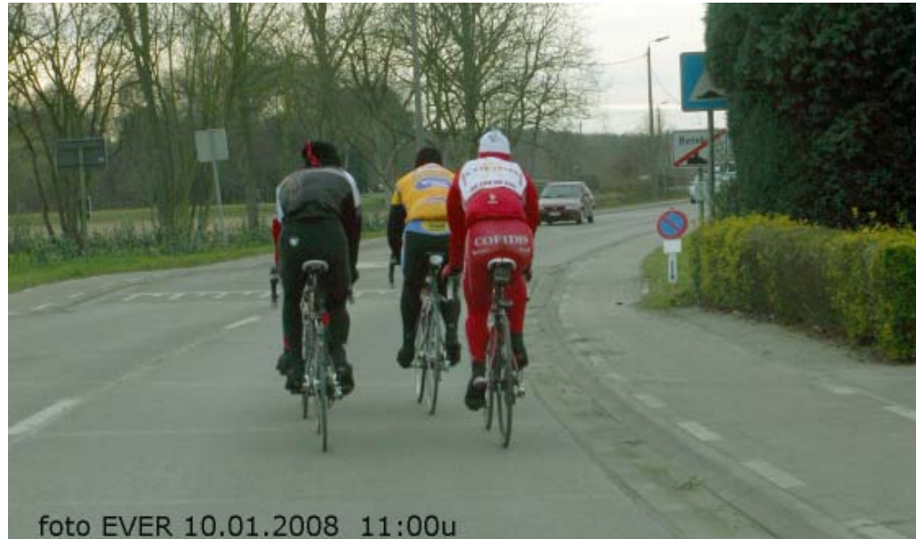
10.01.2008 11:00u

Veel automobilisten in Begijnendijk zijn het meer dan beu dat wielertoeristen de openbare weg gebruiken terwijl er goede fietspaden liggen, maar niemand durft het aan om zich bij de politici, of ergo bij de politie, te gaan beklagen, klagers laten zich nog liever door de agressieve wielertoeristen op het gezicht slaan.