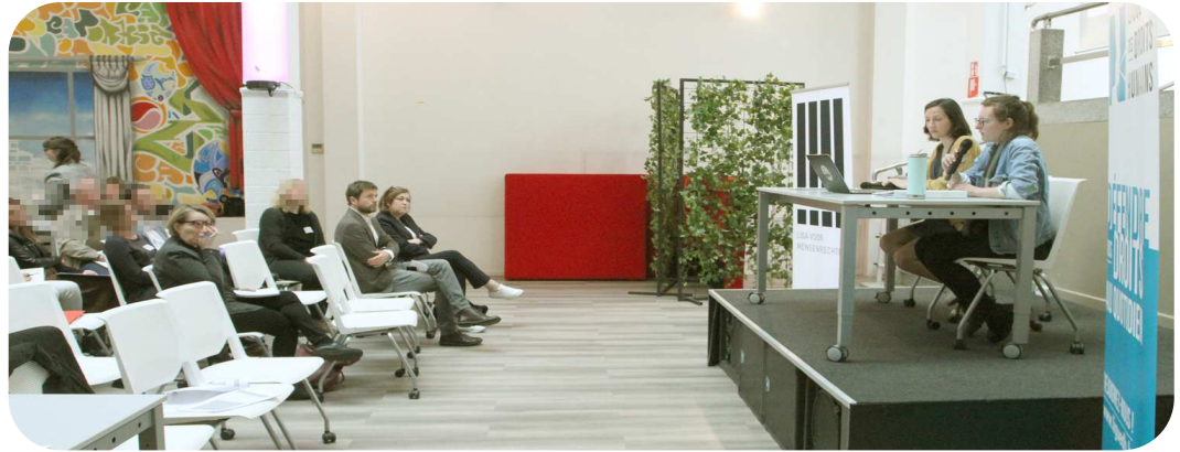
Op het podium : de medewerkers van de Liga die de klachten in het rapport hebben opgesteld

bank staat, krijgt volgende reactie, een passage uit een dossier van dat orgaan : " ... het COC gaat daarbij na of uw persoonsgegevens in de politiegegevensbanken -waaronder de Algemene Nationale Gegevensbank- worden verwerkt en zo ja, of de verwerking in overeenstemming was en is met het wettelijk kader ... ", einde citaat, verder schrijft het COC in