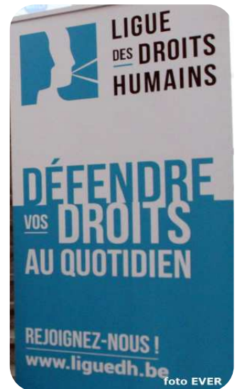
De Liga probeert wel haar best te doen, maar ze is overwegend Franstalig en links.

Over het bestaan en de rol van de binnen de FOD Binnenlandse Zaken opererende Algemene Inspectie -AIG- van de federale politie en van de lokale politie, is er tijdens de studiedag ook met geen woord gerept! De AIG kan ook aangestuurd worden door het parket -lees een vloer waarop gewerkt wordt-. In een