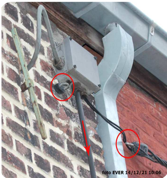
Twee inbreuken: Aansluitkabel -pijl- niet bevestigd - AREI Boek 1 - 5.2.9.5. Verticale trekkrachten. Aftakkabel los van de verankering -cirkels- Aarschotsesteenweg 43.

aan personeel, in regio Leuven zouden er slechts twee technici actief zijn, in de ex PBE vestiging te Lubbeek wat meer, maar ook veel te weinig. Langs alle kanten en ook in andere regio's horen we dezelfde klachten; het is niet gemakkelijk, we mogen niets meer doen vooraleer het allemaal op papier is gezet, er zijn geen budgetten, etc.