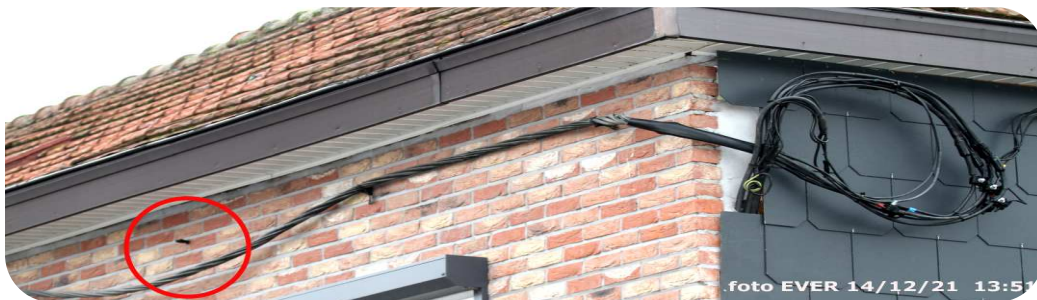
Deze losgekomen bevestiging -cirkel- hebben ze niet hersteld, dat heeft niets vandoen met politiek wel met de "je m'en fous" mentaliteit van de werkmannen van Fluvius System Operator cvba en hun bazen die niet ter plaatse komen kijken.

aan personeel, in regio Leuven zouden er slechts twee technici actief zijn, in de ex PBE vestiging te Lubbeek wat meer, maar ook veel te weinig. Langs alle kanten en ook in andere regio's horen we dezelfde klachten; het is niet gemakkelijk, we mogen niets meer doen vooraleer het allemaal op papier is gezet, er zijn geen budgetten, etc.