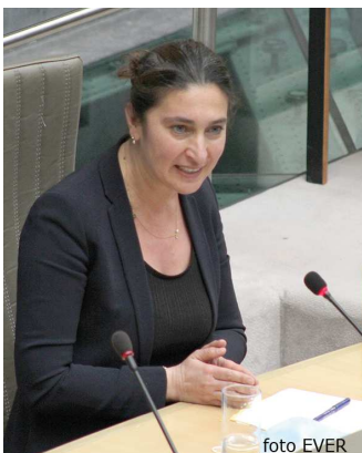
Minister Demir lijkt aan het bidden dat het in orde komt.

Tijdens het debat in het half-rond van 3 maart, vlogen de politieke standpunten van links over het midden naar rechts heen en weer. De Vlaamse Regering onder minister Zual Demir, is op de hoogte van de problematiek maar neemt een afwachtende houding aan, er wordt gewerkt aan een "definitief kaderpad dat voldoende juridisch rechtszeker en wetenschappelijk onderbouwd dient te zijn". Minister Zual