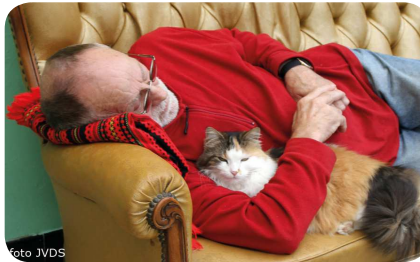
Ook deze lapjeskat, hier rustend in de arm van de auteur van dit artikel, had een hartafwijking en stierf vroegtijdig.