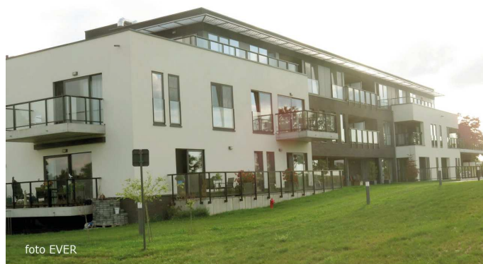
Residentie Nedermolen - drie bouwlagen mocht niet, of beperkt, wat is beperkt?

In december 2005 werd een PV opgemaakt waarbij werd vastgesteld dat op twee percelen -18B en 22R die nu op Geo Vlaanderen niet meer te traceren zijn?- verschillende afvalstoffen, alsmede bouw- en sloopafval werd aangehouden. Het bouwafval dat door bvba JMS werd gestort zou volgens een brief van 12 augustus 2008 door de bouwpolitie aan het Parket geschreven, geruimd zijn. Maar de stortingen uitgevoerd door