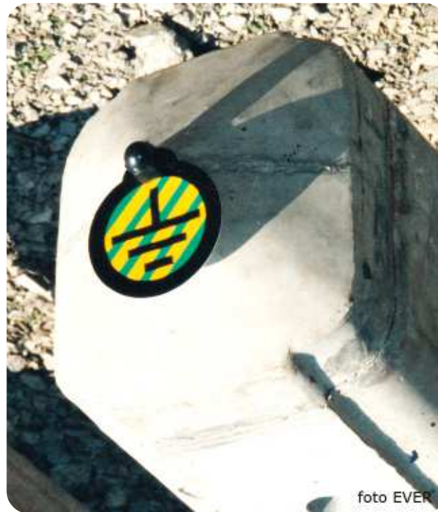
Aardingaansluiting voor de nulleider van het laagspanningsnet boven op een betonpaal

De melding waarvan een kopie afgebeeld op p 2, dateert van november 2002, dat is meer dan 13 jaar geleden. Niettegenstaande het KB van 24 maart 2003 en de