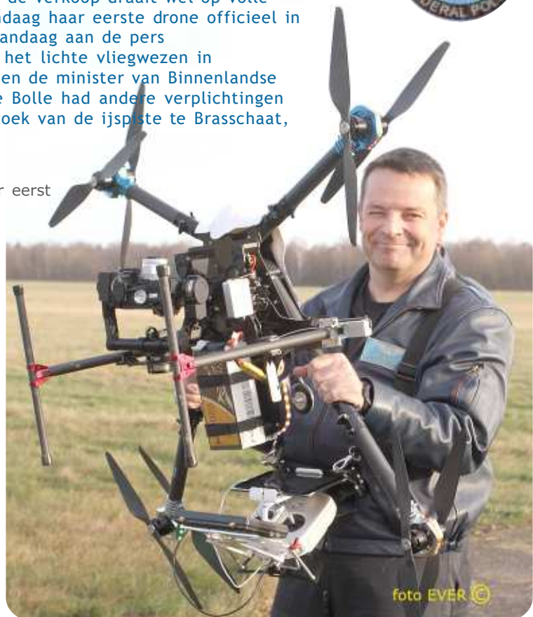
Flight manager van de RPAS X8 met de drone -die slechts 5 kilogram weegt-, in de hand, de payload van de drone is wel 17 kg.