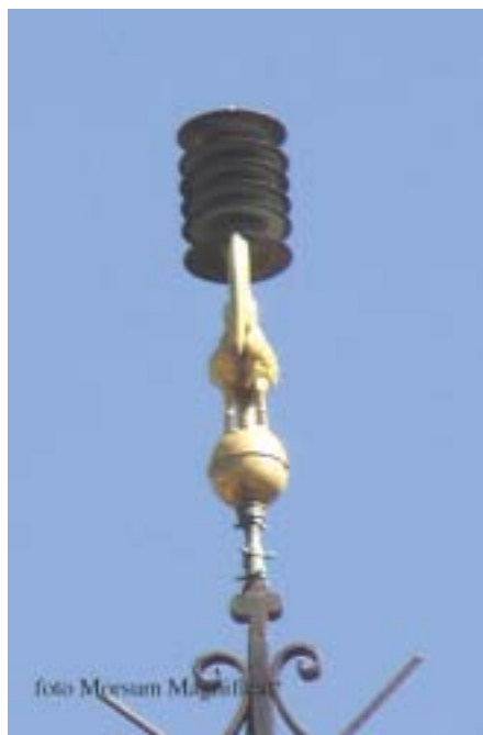
De Radioparatonnerre type Kapton met 6 schijven en daarop Radium 226 email

Als het dunne laagje email loskomt, bijvoorbeeld door een blikseminslag, kunnen de radioactieve deeltjes loskomen en zich in de omgeving verspreiden. Dit keer werd, in tegenstelling tot Oostende, door het Gemeentebestuur van Libin, de Civiele Bescherming van Neufchateau ingeschakeld.