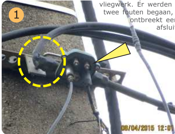
Coaxiale kabel aan connector was geplooid, afsluitweerstand -pijl- aanwezig.

Ter hoogte van huisnummer 61 aan de Domstraat te Baal / Tremelo was een