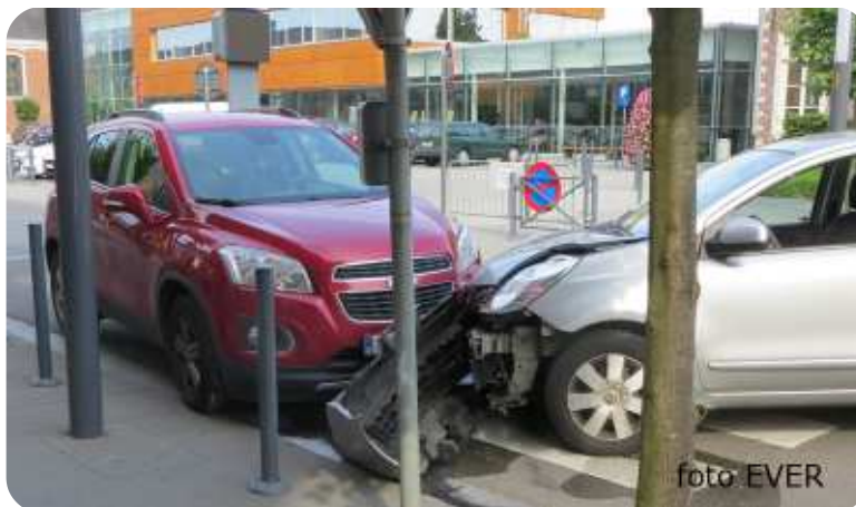
De Nissan schuurde gehavend over het zebrapad om tegen de Chevrolet tot stilstand te komen.

De politie van Tremelo deed ter plaatse de materiële vaststellingen, nam een alcohol test af van Miel, maar voor een verhoor werd gevraagd om vandaag 2 augustus 2015 om 22 uur naar het