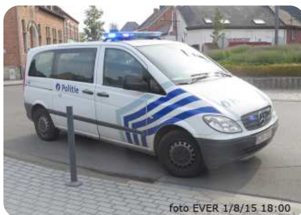
Het duurde drie kwartier vooraleer de politie van de PZ-BRT ter plaatse was.