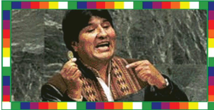
Evo Morales spreekt de UN toe

Een integraal financieel mechanisme om de ecologische schuld aan te pakken.