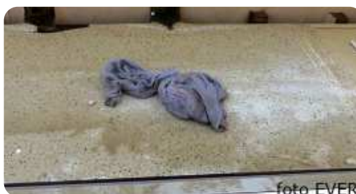
De vuiligheid op de keukenkast

huurder en verhuurster is gaan storten. Ook hier ligt de advocaat omdat het zijn cliënte was die als eerste onterecht de politie op de huurders afstuurde. Dat er plannen zijn om de woning af te breken is ook twijfelachtig, hetzelfde werd in