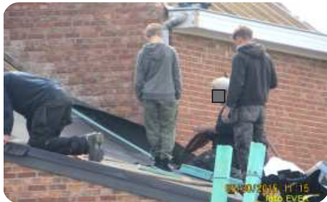
Kinderen op het dak bij werken kan niet