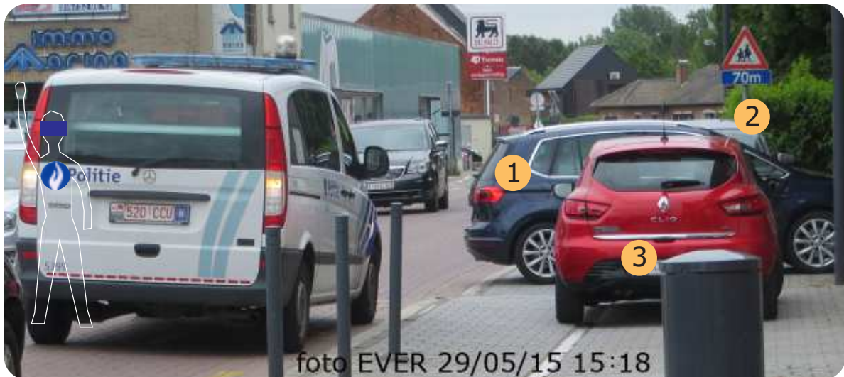
De combi stopt voor de bewoner die vanuit zijn garage achteruit de straat op rijdt

Deze week heeft de federale wegpolitie de cijfers bekend gemaakt van de acties rond verkeersveiligheid wat als een prioriteit wordt aanzien. Met dit artikel geven we aan hoe het er in de praktijk in Tremelo bij de PZ BRT aan toe gaat.