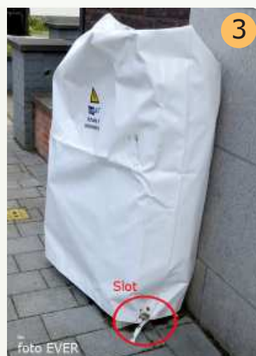
Na een tweede melding van MM verzegelde Eandis de kast.