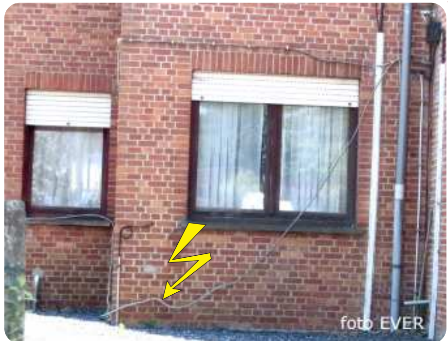
Deze loshangende elektrische kabel kan niet door de beugel en is een teken aan de wand dat er veel meer aan de hand is met de elektrische installatie van café Volkshuis.

-foto inzet-. De kabel vertrekt duidelijk in het deel waar café Volkshuis wordt uitgebouwd. Het wordt tijd dat WASO eens een kijkje gaat nemen in café Volkshuis. Normaal zou de burgemeester bij publiek toegankelijke gelegenheden, de brandweer een inspectie moeten laten uitvoeren,