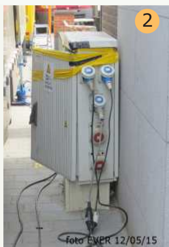
Marktkramers verwijderden de plakband en sloten opnieuw aan.