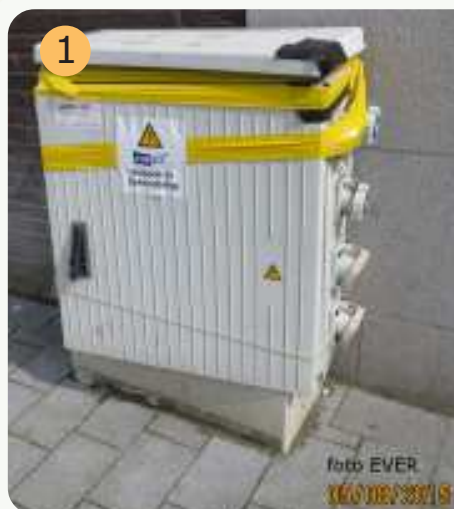
Eandis plakte de kast op een amateuristische wijze dicht.