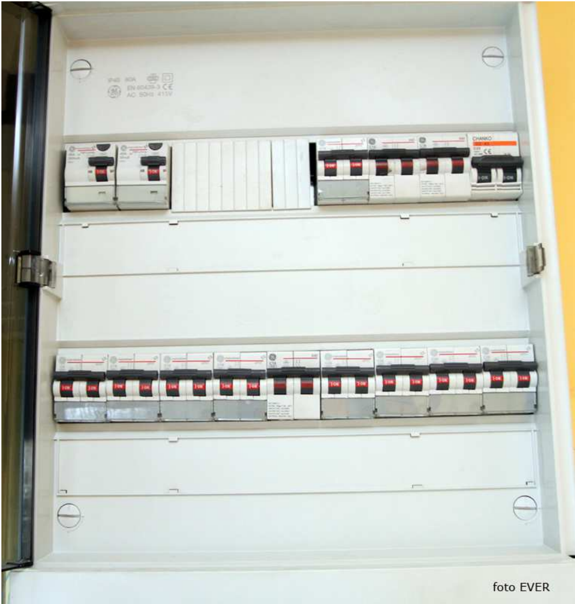
Kringen zijn niet gemerkt