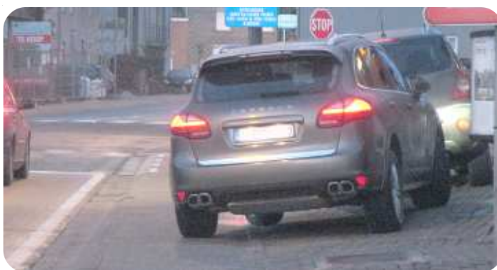
Dagelijks hinder voor fietsers, gewoonlijk grote bakken, zoals deze Porsche.