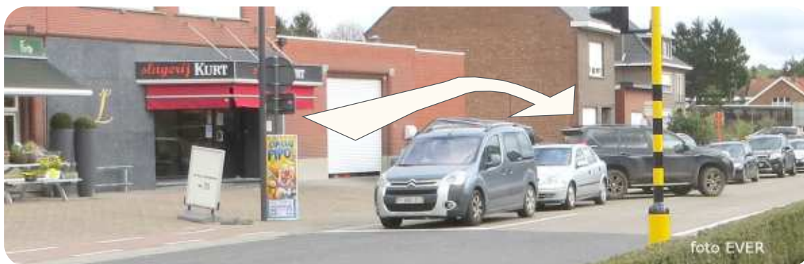
Vertrekken vanaf een verhoogde berm, niet kunnen wachten tot er zicht is op het aankomend verkeer en toch tussen de auto's, die voor het licht aanschuiven, de drukke Baalsebaan oprijden.