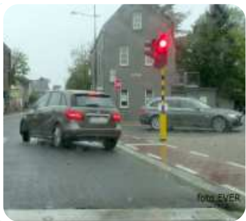
Vanuit illegaal geparkeerde toestand op de koop toe netjes wachtende automobilisten vóór steken !