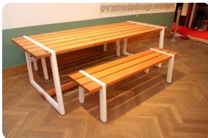
Nominatie voor product op de markt : Linea - de tafel is 2,40 meter lang.

Producent Koppers & Wuytens Prijs van de tafel : 2.300 euro zitbank : 700 euro