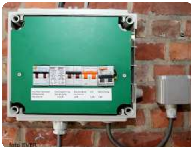
Foto links : Lasdoos in de garage -boordevol fouten- die voeding geeft aan de centrale verwarming, stopcontact voor wasmachine, droogkast. Kortom levensgevaarlijk kunst- en vliegwerk terwijl het hoofd van de klusjesdienst van het OCMW Jos D., elektricien is. Foto rechts : huurder herstelde de foute installatie maar de eigenares wil dat niet terugbetalen.

van p. 2 OCMW Jan Van Herck -CD&V- " terloops " dat de woning nood heeft aan 5 à 6000 liter stookolie per jaar -sic-, alsof dat normaal is. Het OCMW had als verhuurder haar wettelijke verantwoordelijkheid moeten opnemen en zéker het BVR van 8 december 2006 moeten respecteren.