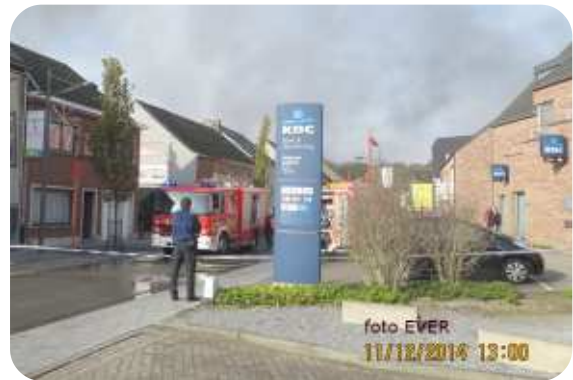
13:00 Perimeter ingesteld, Inp houdt de wacht