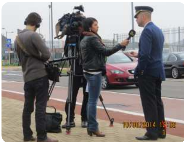
Alternatieve persconferentie waarbij de klassieke pers iedereen voor de kar spant.

Dat er al jaren sprake is van een rijbewijs met punten is een feit, dat het nog steeds niet in voege is, ook. Ook de politie ligt zowel lokaal als federaal onder de "sloef" van de politiek en dat is fout. De politiek wil geen lik op stuk beleid maar altijd zalven om het politiek blazen op te poetsen. De politie kan haar taak niet naar behoren uitvoeren, het zijn de slippendragers van de politiek. Een korpschef van de lokale politie is een politicus in uniform. We zijn dat permanent politiek spel aan de top van de federale politie naar voorbeeld van