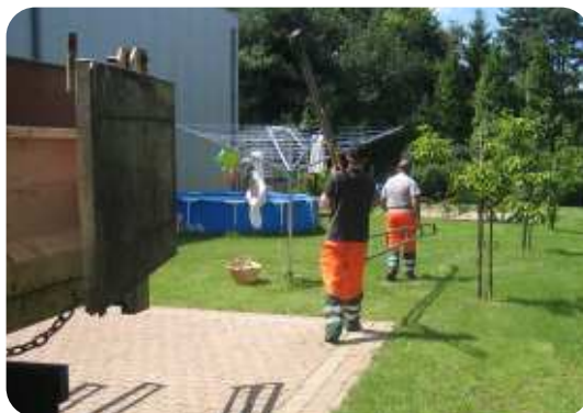
Hier werd op privé terrein een feesttent voor de chiro opgebouwd. Ook twee gemeentevoertuigen werden daarvoor ingezet.