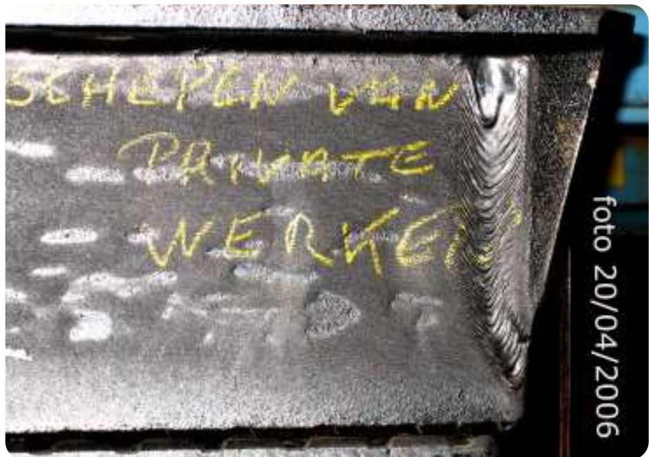
In april 2006 schreven gemeentearbeiders met geel krijt op een metalen riooldeksel, waarvan er reserve in de werkplaats te vinden zijn, Schepen van Private Werken .....

De hierboven beschreven werken die door gemeentepersoneel werden uitgevoerd, is slechts een fractie van wat ons is toegespeeld. Over de affaire van het asfalt dat bij de Schepen van Openbare Werken én burgemeester is terecht gekomen, hebben wij ons oor nog wat te luisteren gelegd. Het klopt inderdaad dat in die periode asfalt is gebruikt voor de tennismuren van