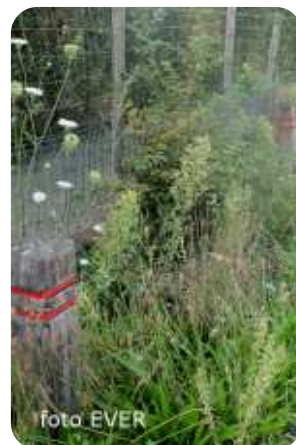
Paaltjes aan de Stock-Shop, overwoekert, maar ze staan er.

van de jongeren die daar parkeren. Er werden bijgevolg op het terrein van Liekens aan de Baalsebaan 253 -waar de Doe het Zelf Stock-Shop is gevestigd-, paaltjes uit gerecycleerd kunststof geplaatst. Dat gebeurde opnieuw door gemeentepersoneel. We hebben daarover vragen gesteld aan de gemeente, maar ook daarop weer geen reactie. Architect Rik