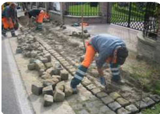
Moorsemsestraat : Openbaar of privé domein? Tremelo wil op onze vragen niet antwoorden. De betrokken eigenaar legt de telefoon in.

Bij de eigenaar van het terrein waar een tent werd opgebouwd -foto- werd dat niet ontkend. Maar de persoon in kwestie herinnert zich dat het mogelijk over een burenbarebecue ging en "we kregen van de gemeente toen ook de