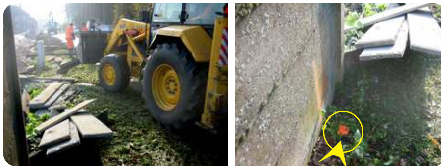
Aan de Turfweg werd, met inzet van gemeentelijke middelen, een scheidingswand weggehaald. De markering van de perceelsgrens toont duidelijk aan dat de wand op privé grond staat ...

tafels en de stoelen" klinkt het. Het is inderdaad wel al een poosje geleden, maar mensen hebben een selectief geheugen.