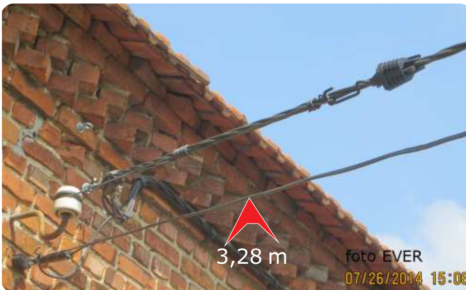
Aftakking Domstraat 43 - Diverse inbreuken

Staatssecretaris Fonck moet externe keuringsorganismen inschakelen