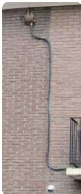
Schrieksebaan 34 ▼