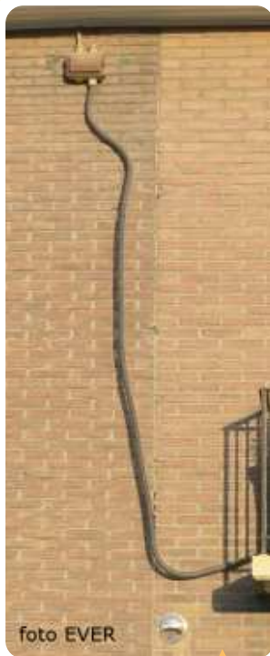
Grote Bollostraat 4