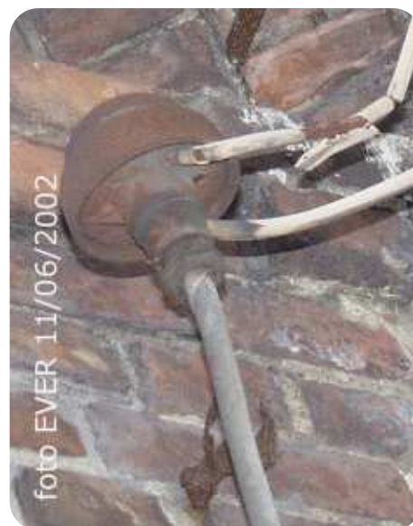
Schrieksebaan 137 Tremelo in 2002