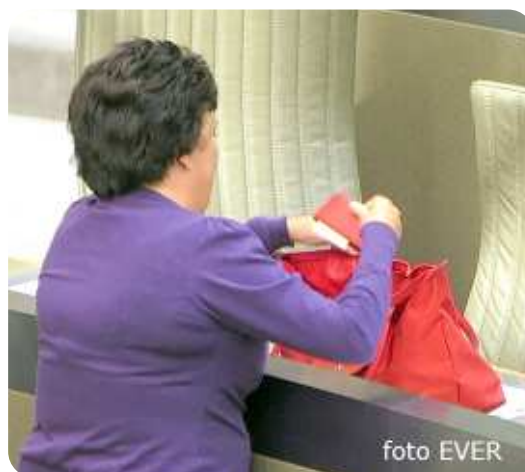
Opruimen die rode boel