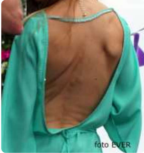
Reclame voor anorexia?