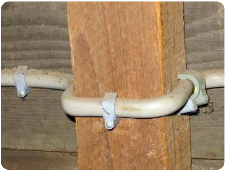
Kromtestraal art. 207.04.d AREI.