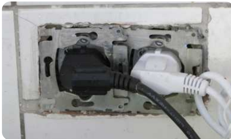
Stopcontacten keuken - elektrocutiegevaar art. 34 AREI