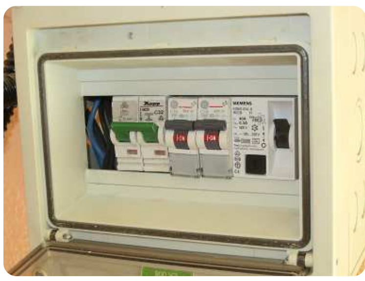
Opening in hoofdbord art. 37 AREI.

Hoofdbord Laagspanning 240 V in één appartement : Strijdig met het KB van 18 juli 1997 art. 6 6° toegankelijkheid smeltveiligheden.