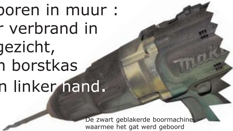
De zwart geblakerde boormachine waarmee het gat werd geboord