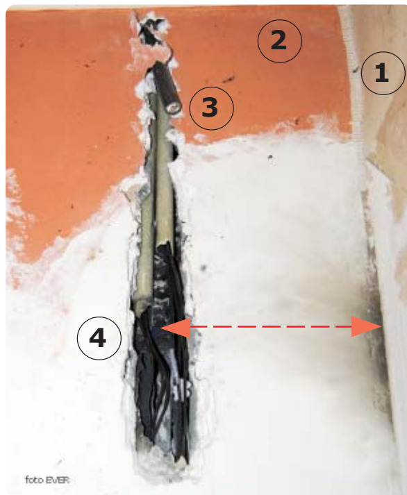
1. Binnenmuur 2. Buitenmuur 3. Toevoerleiding EVVB 4G6 Infrac -ligt vlak onder de bepleistering- 4. Plaats waar werd geboord.

Wegens de kortsluiting, accidenteel veroorzaakt door de boor, is er een overbelasting van het net ontstaan die wegens het ontbreken van een beveiliging niet beëindigd kon worden, dat kan enkel wanneer er een smeltzekering aanwezig is.