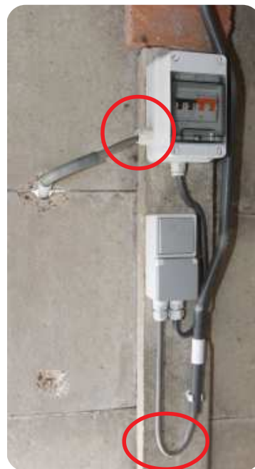
Ook niet gezien door het organisme : Foto links : De extra aangebrachte wartelinvoer is niet voorzien in de behuizing -art. 5 AREI-. Bovendien wordt door de extra invoer van geleiders art. 207.07 van het AREI met de voeten getreden. Foto rechts : Ook hier heeft de keurder niet gezien dat in feite de kromtestraal -art. 207.04- met de voeten is getreden. Ook hier wordt door het extra, niet in de behuizing daartoe voorziene inbrengen van geleiders, art. 207.07 met de voeten getreden. Het gaat hier om een onderbord dat ook niet door de keurder als dusdanig is gezien noch gekeurd!.