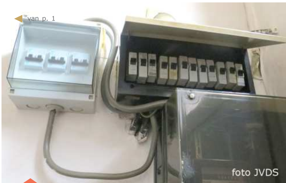
← van p. 1