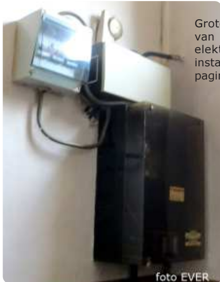
Grotere foto's van de elektrische installatie op pagina 2