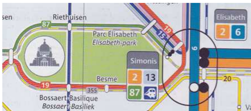
Nieuwe kaart met de metro, tram en buslijnen

◀ van p. 1 reizigers. Simonis is een knooppunt van twee metrolijnen /substations - lijn 2 en 6-. Het ene perron loopt parallel met het Elisabethpark en het andere met de Leopold II tunnel. Over de benaming van de huidige bestemming Simonis hadden reizigers vraagtekens, reden waarom werd overlegd hoe de situatie te verduidelijken.