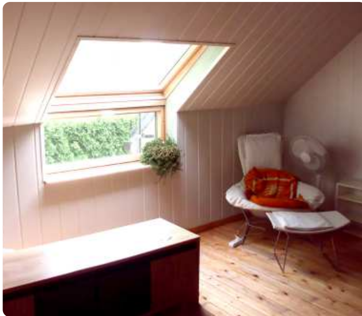
Een stukje van de studio in de woning van Dhoore.

Aandacht gaat naar houding Vrederechter van CD&V strekking.