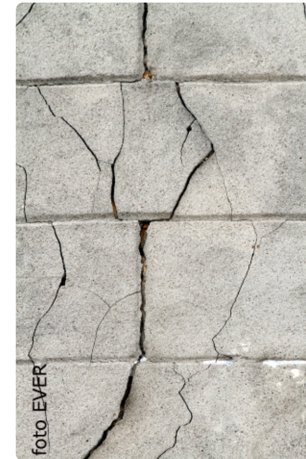
Deze -en andere- scheuren in de gevel krijgen slechts 3 strafpunten. Instortingsgevaar telt dus amper.

Na het fluwelen verslag van Wonen Vlaanderen, -wat toch nog 16 strafpunten toekende-, komt plotseling de gemeente Lanaken op de proppen. In het verleden werd aan Lanaken gevraagd om haar verantwoordelijkheid op te nemen, maar Marino en