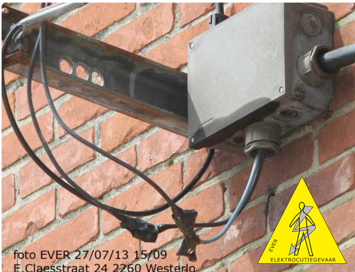
27/07/13 15/09 E.Claesstraat 24 2260 Westerlo