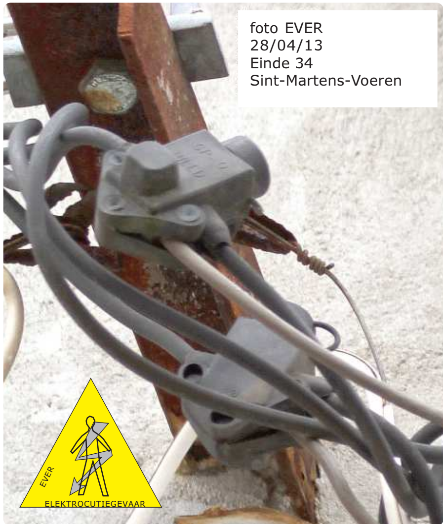
28/04/13 Einde 34 Sint-Martens-Voeren