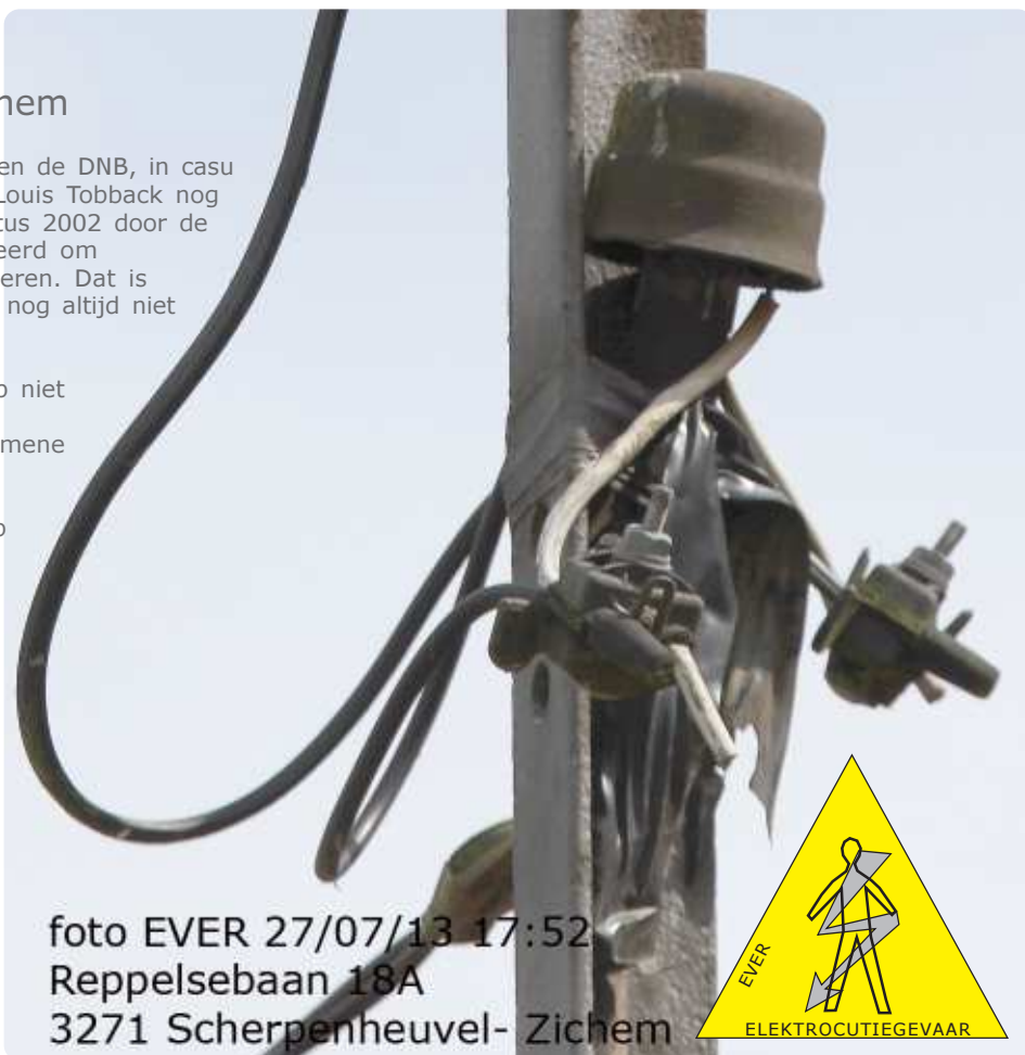
27/07/13 17:52 Reppelsebaan 18A 3271 Scherpenheuvel- Zichem

Ook hier weer een resem overtredingen op het AREI.