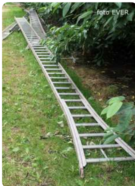
De 9m lange aluminium ladder werd Joeri fataal.

Een ongeval met elektrische installaties moet volgens artikel 197 van het MB van 10 maart 1981 aan het Ministerie van Economische Zaken gemeld worden, dat blijkt tot vandaag, drie dagen na het ongeval, nog niet gebeurd te zijn. Zelfs wanneer de FOD Economie op de hoogte is,