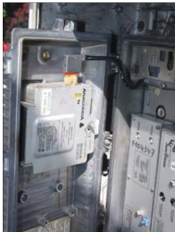
Dit is analoge techniek uit de jaren '70. Om dat te vervangen zijn er miljoenen Euro's nodig en die hebben ze niet !

Bij de verkoop van de netten door de Intercommunales hebben ze