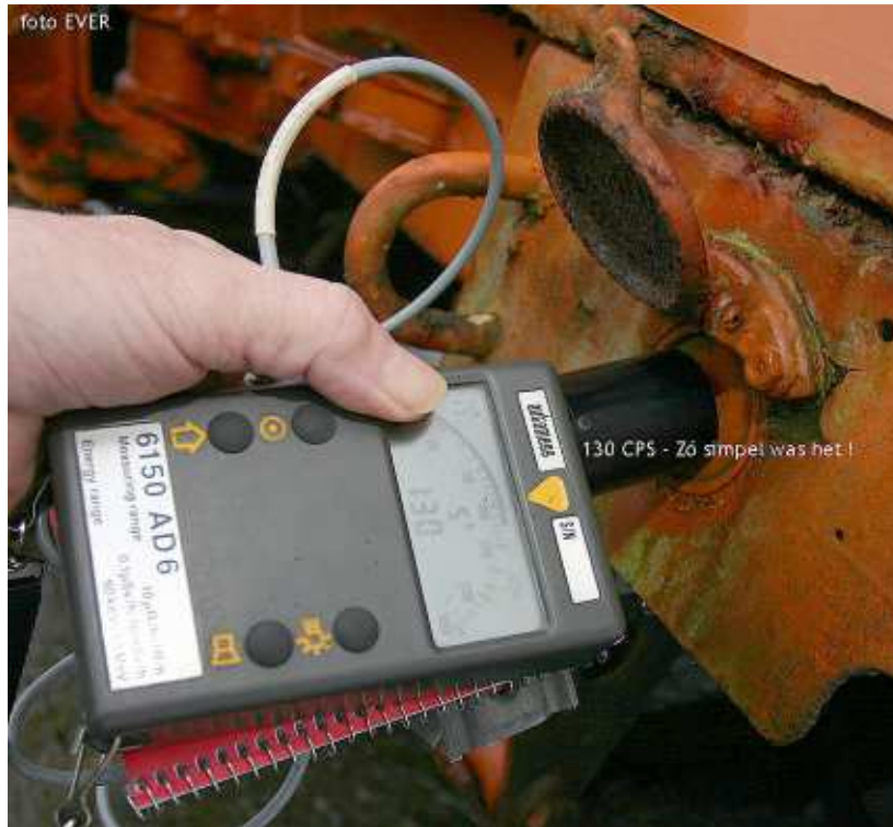
Civiele Bescherming, twee meettoestellen en twee AGS'ers waren niet in staat om dit metertje te ontdekken. Morsum Magnificat deed dat in 10 minuten ! Waarom konden zij dat met hun AD-2 niet meten ?

(contanimatie) meter van Thermo meegebracht, maar het verhoopte resultaat kwam er niettegenstaande toch niet, óók niet door de aanwezigheid van maar liefst twee AGS'ers !