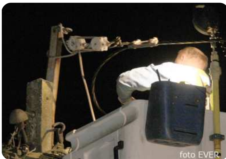
Pas nadat wij de eerste foto's hadden genomen werden de PBM boven gehaald.