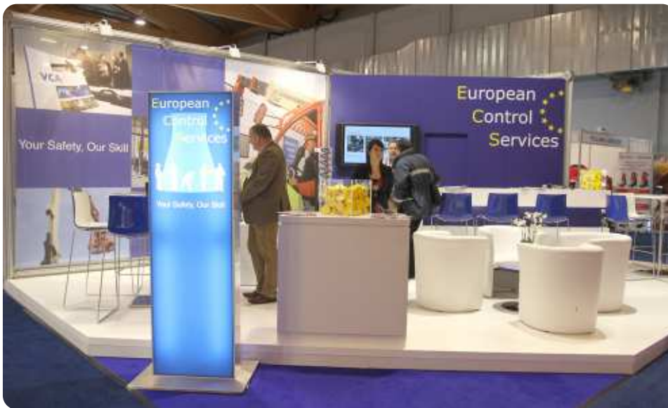
Een opvallende stand : Achter deze decadentie zit duidelijk veel kapitaal

Commerciële decadentie die de arbeidsveiligheid niet dient