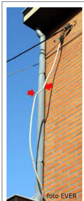
Pannestraat 198 - Aftakking hangt los en de buitenmantel van de kabel is beschadigd.