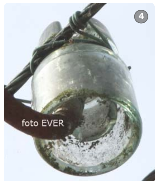
Foto 1 en 4 : De paal wijkt fel af van de verticaliteit -art. 155.01-04 en twee isolatoren zijn stuk -foto 4 art. 156 AREI- of werden verkeerd gebruikt -art. 5 AREI-

Foto 2 : Nieuwe aftakking aan gevel - de VOB geleiders van de XVB kunnen niet als geïsoleerd worden beschouwd -art. 159.01 AREI-.