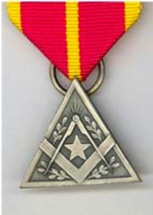
La Tolérance een afdeling van de Groot Loge van België gevestigd te Hasselt

Beckers van p. 3 maakte daarop commentaar als : "... ik kan mij trouwens van de indruk niet ontdoen dat Rubens, de procureur, mee in het complot zit ...". Tijdens dat gesprek werd duidelijk dat Procureur Rubens ook bezwarend materiaal over Beckers heeft -maar ook over Reynders, red.-