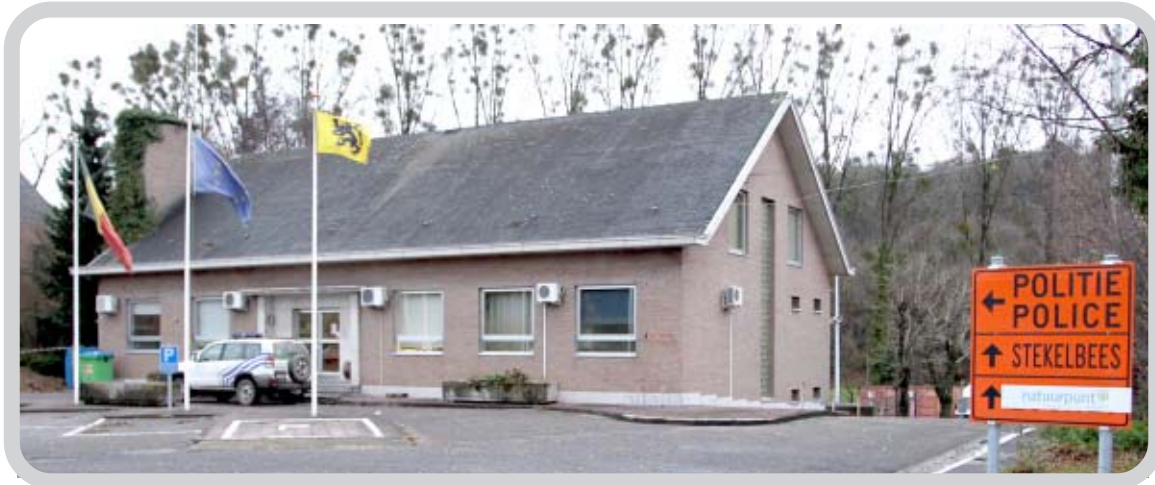
Politiegebouw Voeren, kinderopvang Stekelbees en Natuurpunt, drie vliegen in een klap.