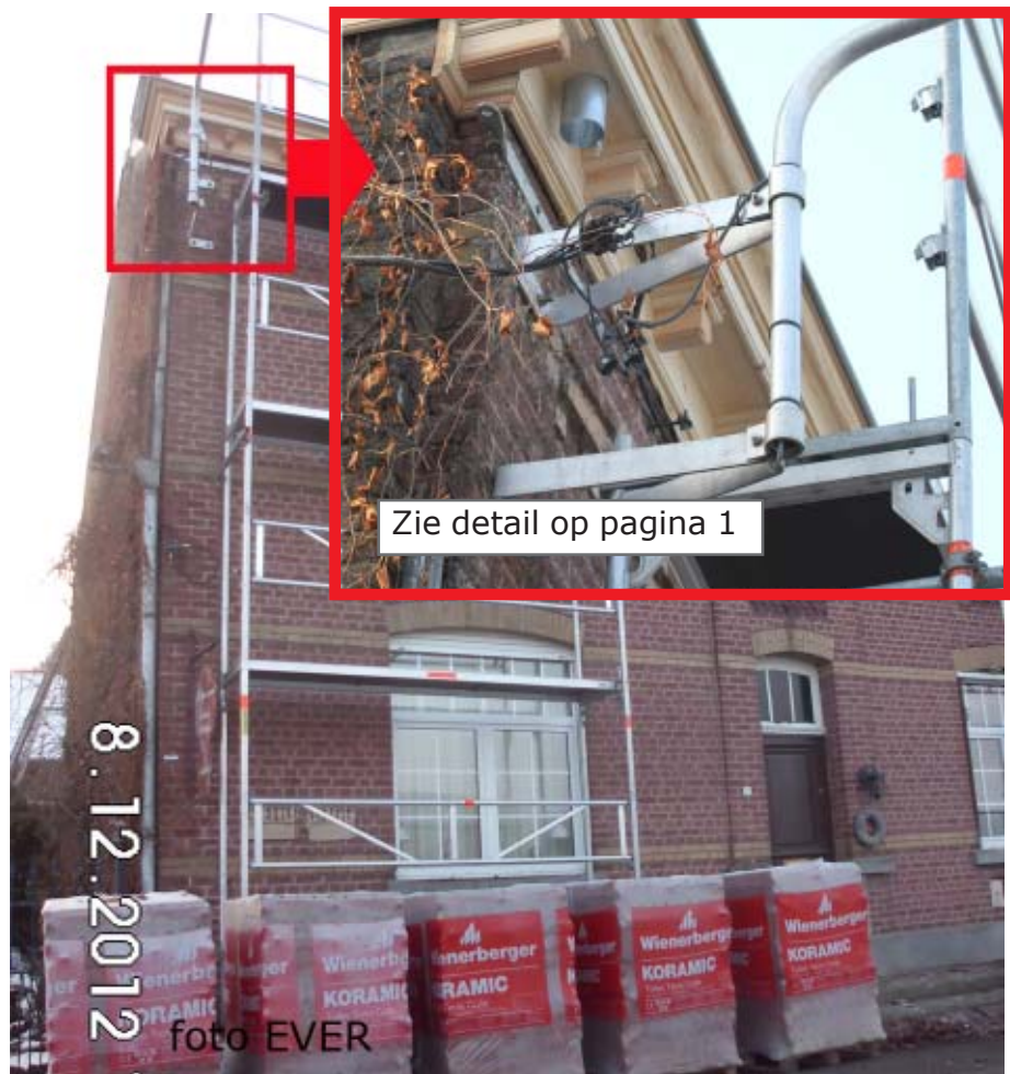
De stelling komt dicht bij het LS net en de verbindingen van het openbaar verlichtingsnet waarvan de geleiders als "blank" moeten worden aanzien, alleen de types VIFB en BAXB worden als geïsoleerd aanzien art. 159.01