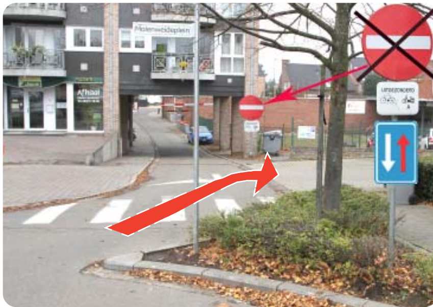
Te wijzigen situatie aan het Molenweideplein

In de Stationsstraat in Lanaken en omgeving gebeurden de voorbije maanden, vooral -en zoals was verwacht- na de invoering van de weedpas in Maastricht, diverse overvallen. De laatste, twee weken geleden op een juwelier. Die overvallers werden door omstanders en niet op zijn minst door een toevallige passant, buitenwipper K. uit Smeermaas, in de kraag gevat, de politie hoefde de twee overvallers, bij wijze van spreken, enkel maar de boeien om te doen. Stoere burgers, zelfs een krachtpatser als K. beseffen niet hoeveel risico's zij nemen om de gewapende overvallers te lijf te gaan, de man had evengoed een kogel door het hoofd kunnen krijgen, het is niet de eerste keer dat zoiets gebeurt. Indruk heeft die man zeker gemaakt op de omstanders.