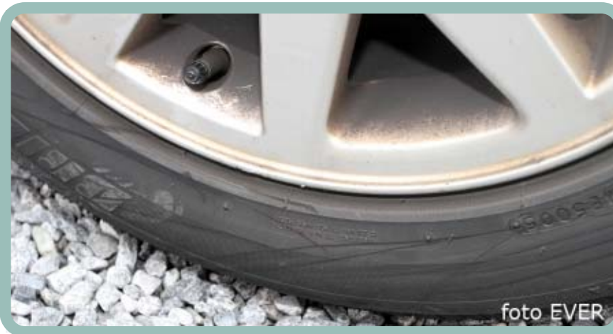
De band vertoont duidelijke sporen van pogingen tot vernieling aangebracht bij nacht en op privaat eigendom.