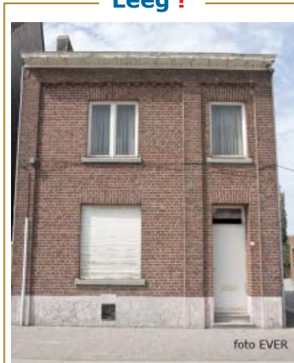
Berenhofstraat 64 waarbij Marc Geurts -CD&V- betrokken is