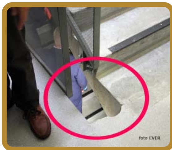
Dit was -mogelijk door de drukte- het enige wat we hebben kunnen fotograferen dat een veiligheidsprobleem is.

◦ De dienst Arrondissementeel Informatiekruispunt , afgekort AIK, beheert, analyseert en faciliteert de informatiestromen tussen de verschillende politiediensten. Ook wordt door de dienst informatie