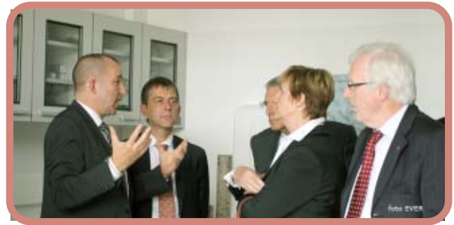
Uitleg aan de Staatssecretaris en beide Procureurs in één van de nieuwe labo's.

Sommige gazetten schreven dat er volgens Staatssecretaris Servais Verherstraeten,